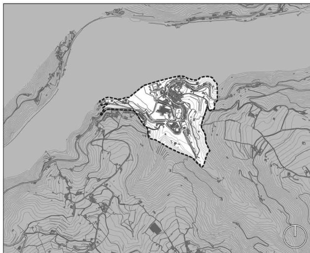
ÁREAS DE REABILITAÇÃO URBANA DE RESENDE ARU NÚCLEO URBANO DE CALDAS DE AREGOS