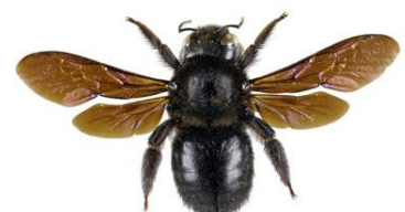
Abelha Carpinteira, Xylocopa violacea