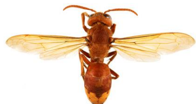
Vespa Oriental, Vespa orientalis