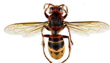
Vespa Europeia, Vespa crabro